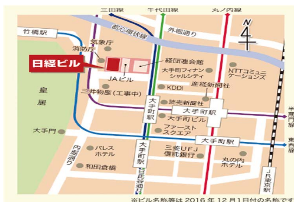
図-1 日経ホール（日経ビル）周辺の略図